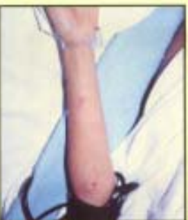
Ir-raxx fil-bidu tal-marda ...

Għalhekk teżisi medicina preventiva għal dan il-marid, din mhiġex rakkomandata lil min kellu biss xi kuntatt żgħir mal-marid, ngħidu ahna, vjaġġa fl-istess karozza, poggja bilqiegħda hdejh, tkellem miegħu jew għadda min magħnub. Mill-banda l-oħra, fil-kuntatti mill-qrib jentieg li tittiehed il-kura preventiva mill-aktar fis, meta u kif jordna t-tabib. F'xi każi biss jkun jinhieg ukoll it-tliqim.