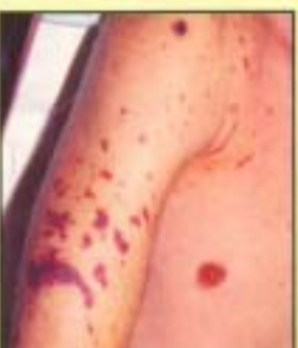
... u meta l-marda tidhol 'il gewwa