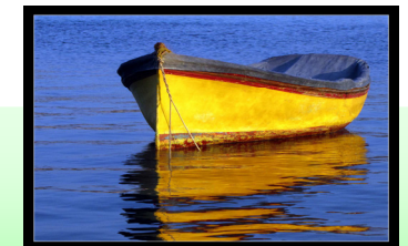
Ritratti: Noel Mallia